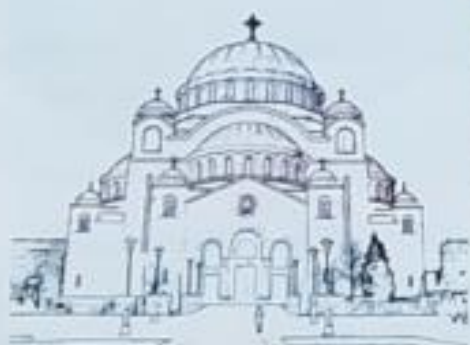
Храм Светог Саве Врачар, Београд