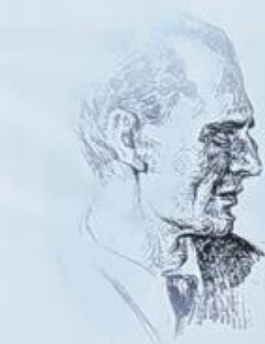
Светозар Душанић – портрет, рад Паје Јовановића

053/423-126 053/423-375 os097@skolers.org